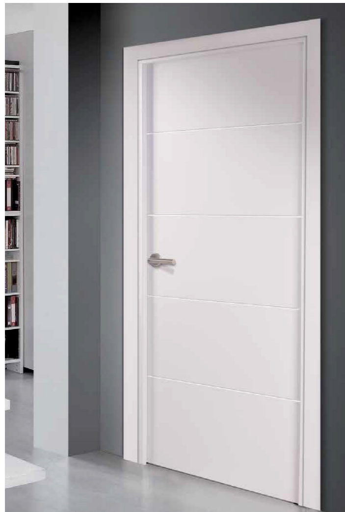
^ Puertas de paso lacadas en blanco con cierre imantado White lacquered interior doors with magnetized lock