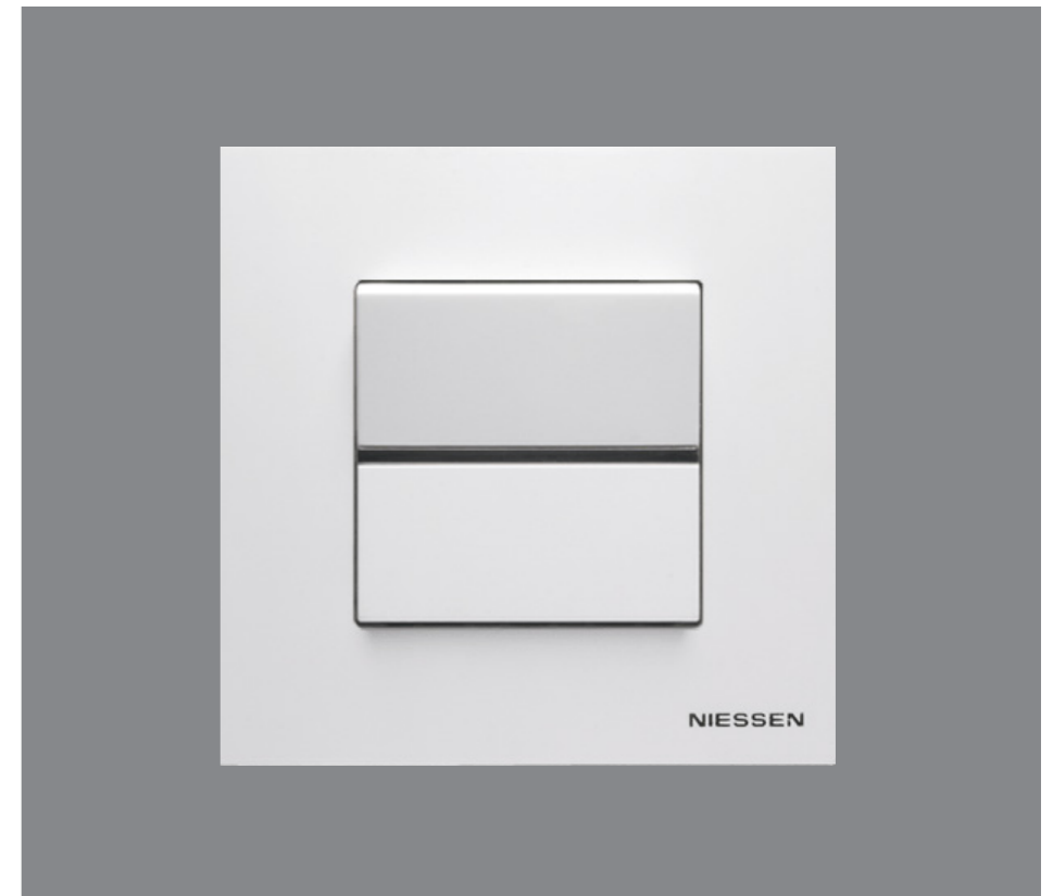
Mecanismos Zenit de NIESSEN. Zenit from NIESSEN electric fittings.