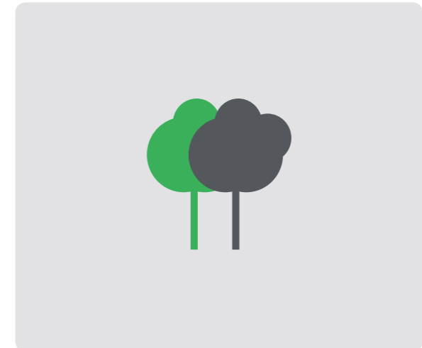
Edificio construido según normativa de eficiencia energética. Building constructed in accordance with the last energy efficiency standards.

AVISO LEGAL IMPORTANTE: PATRIMI RESORTS, S.L. manifiesta que todo el material publicitario (tal como planos, imágenes, animaciones 3D, renders, videos, folletos, etc.) que se utiliza para la actividad de promoción de la venta de las viviendas, cumplen una función de mera presentación orientadora de las características que tendrá la vivienda una vez terminada. PATRIMI RESORTS, S.L. quedará exenta de cualquier responsabilidad frente al comprador si, en la fecha de la entrega, la vivienda presente diferencias respecto a dichos planos, imágenes y animaciones en aspectos decorativos y de acabado final, que no afecten elementos estructurales de la vivienda.