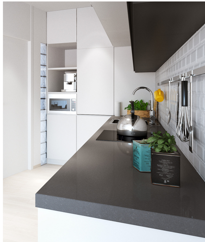
Encimera Quarz Compac gris Grey Quarz Compac worktop.