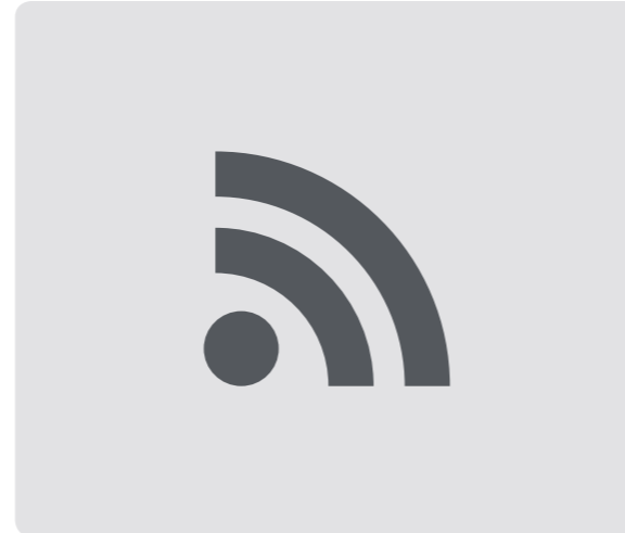
Preinstalación de telecomunicaciones según normativa (2 líneas de teléfono, tv por cable, vía satélite e interfono). Pre-installed telecommunications network in accordance with the law (2 telephone lines, cable tv, satellite tv and intercom).