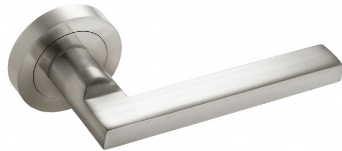
^ Manivelas rectangulares en acero inox. Stainless Steel handlers.