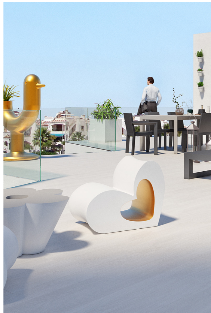
Fachada combinada en monocapa y piedra natural Combined façade rendering with natural stone.