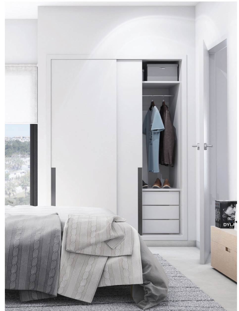
^ Armarios empotrados con puertas correderas. Cajoneras incluidas . Built in wardrobes with sliding doors. Drawers included.