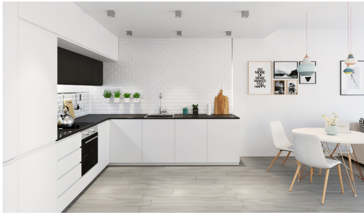
Cocina: Muebles bajos y columnas blanco mate, muebles altos en gris oscuro mate. Kitchen: Mate white low covers and columns, dark grey mate high covers.