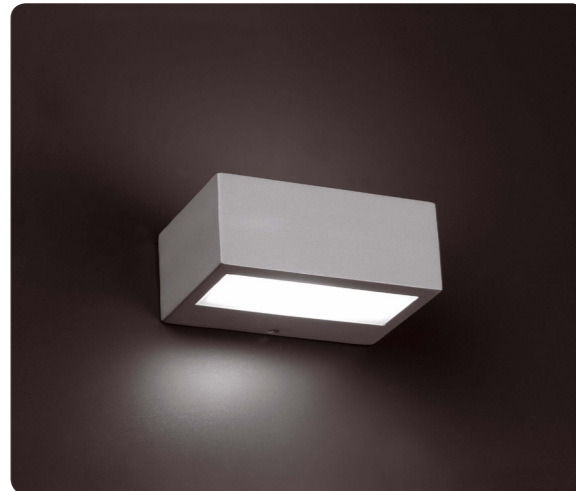
Luces exteriores incluidas en terraza y solarium Exterior lights included on the terraces & solarium