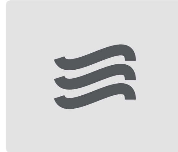
Instalación de agua caliente por aerotermia, con acumulador y calentador eléctrico. Hot water system powered by aerothermia with deposit and electrical boiler.